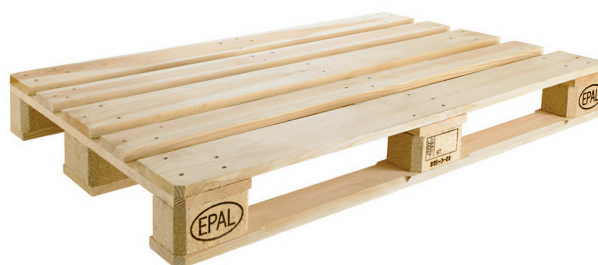
EPAL: 120 x 80 x 14,4 cm (Gewicht: ca. 20 kg)