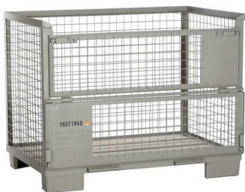
Gitterbox: 124 x 83,5 x 97 cm (Gewicht: ca. 70 kg)